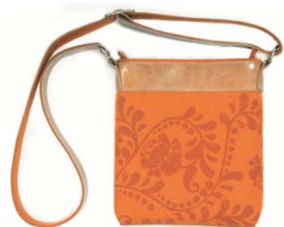
Dorothee Lehnen B1.O.C.20