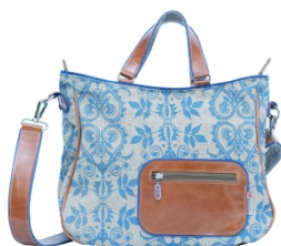
Dorothee Lehnen B1.O.C.20

Ehemalige Aussteller der Design-Insel und weitere innovative Unternehmen präsentieren ihre Produkte in der Halle B1 Erdgeschoss. Damit gibt es – neben der Design-Insel – eine zweite Sonderfläche für individuelle, besondere Produkte: