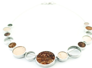
Culture Mix B7.E.06