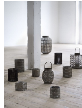
Cozy Room A4.B.08